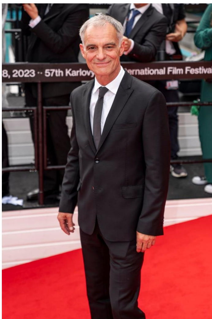
Ivan Trojan

Herec Ivan Trojan patří k nejobsazovanějším českým filmovým, televizním a divadelním hercům posledního čtvrtstoletí.