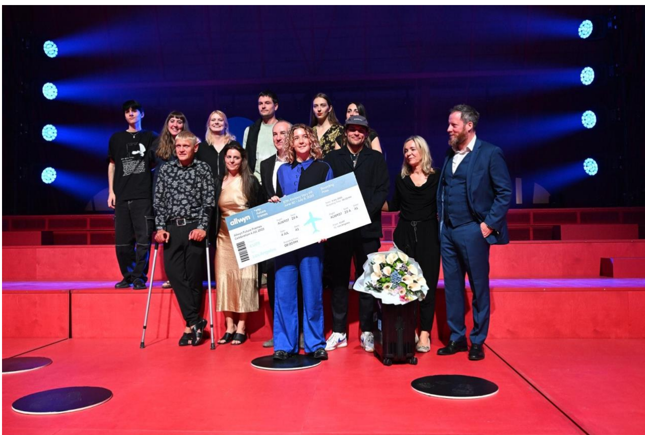
Účastníci Future Frames na loňském MFF KV

Program Future Frames – Generation NEXT of European Cinema , organizovaný společností MFF Karlovy Vary a European Film Promotion, již od roku 2015 pomáhá talentovaným evropským režisérům nastartovat jejich kariéru ve filmovém průmyslu. Díky partnerství s předním světovým provozovatelem loterií, společností Allwyn, a spolupráci s americkou talentovou agenturou UTA a společností Range Media Partners program Future Frames v loňském roce zásadně rozšířil okruh příležitostí, které jsou mladým filmařům v jeho rámci poskytovány.