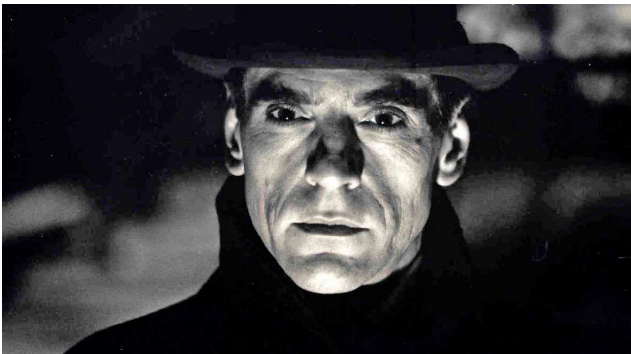
Kafka, režie Steven Soderbergh

V ojedinelé retrospektivě „ Touha stát se Indiánem: Kafka a film “ festival uvede kinematografickou reflexi díla nejlivnější postavy literatury 20. století od tvůrců jako Orson Welles, Martin Scorsese, Ousmane Sembene, Jan Němec nebo Steven Soderbergh.